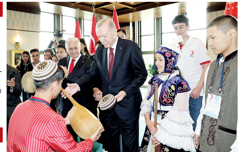
Cumhurbaşkanı Erdoğan, 23 Nisan Ulusal Egemenlik ve Çocuk Bayramı dolayısıyla Külliye'de Türk Dünyası Çocukları ve TRT Çocuk Şenliği Konuk Çocukları ile bir araya geldi.

■ SON günlerde DEM Parti'yle ilgili çıkan tartışmalara da değinen Erdoğan, "Türkiye'de hepimizi temsil eden değerler vardır. Bunları dışlamak, birlik ve bütünlüğümüze kastetmek anlamına gelir ve tabii ki bunun da bir karşılığı vardır. Bunları daha önce de söyledim. Sayın Devlet Bahçeli'nin yapmış olduğu açıklamalar da anayasa hükmünün icrasından başka bir şey değildir. Aynı durum şu anda benim için de geçerlidir. Anayasanın hükümlerini kimler çiğnemeye kalkıyorsa bedelini de ödemeye hazır olmalıdır" ifadelerini kullandı. / 6'DA