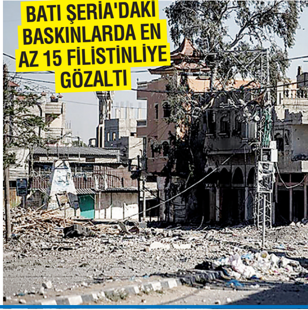
BATI ŞERİA'DAKİ BASKINLARDA EN AZ 15 FİLİSTİNLİYE GÖZALTI

■ FİLİSTİN resmi ajansı WAFAN'ın haberine göre İsrail ordusu, Refah şehrinin Avni Dahir Caddesi'ni hedef aldı. Saldırı sonucu bir Filistinli hayatını kaybetti. İsrail savaş uçaklarının, Gazze'nin güneyindeki Sabra Mahallesi'nde Şireyih ailesine ait bir evi bombalaması sonucu bir kadın öldü, çok sayıda kişi yaralandı. UAD, yeni tedbir kararlarında, İsrail'in Refah'a yönelik saldırılarını derhal durdurmasına, insani yardımları engellememesine ve suçlarını araştırarak BM görevlilerinin Gazze'ye girişine izin vermesine hükmetmişti. UAD'nin İsrail hakkındaki yeni tedbir kararlarını açıklamasından kısa süre sonra İsrail ordusuna ait savaş uçakları, dün Refah kentinin merkezindeki birçok bölgeyi yoğun şekilde bombalayarak çok sayıda Filistinliyi yaralamıştı. / 7'DE