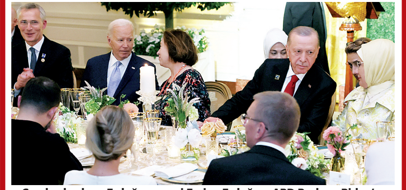
Cumhurbaşkanı Erdoğan ve eşi Emine Erdoğan, ABD Başkanı Biden'ın NATO Devlet ve Hükümet Başkanları Zirvesi kapsamında, devlet ve hükümet başkanları ile eşleri onuruna verdiği resmi akşam yemeğine katıldı.

■ ANCAK Esad yönetimi teklifi iki ülke arasındaki yeni normalleşme adımlarının bir parti üzerinden değil iki devlet arasında daha üst bir perdeden kurmanın doğru olacağını düşüncesiyle reddetmişti.