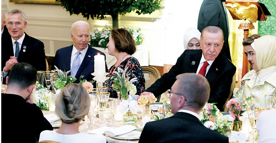
Cumhurbaşkanı Erdoğan ve eşi Emine Erdoğan, ABD Başkanı Biden'in NATO Devlet ve Hükümet Başkanları Zirvesi kapsamında, devlet ve hükümet başkanları ile eşleri onuruna verdiği resmi akşam yemeğine katıldı.

Cumhurbaşkanı Erdoğan, NATO Devlet ve Hükümet Başkanları Zirvesi'ne katılmak üzere geldiği ABD'nin başkenti Washington'da temaslarına de-