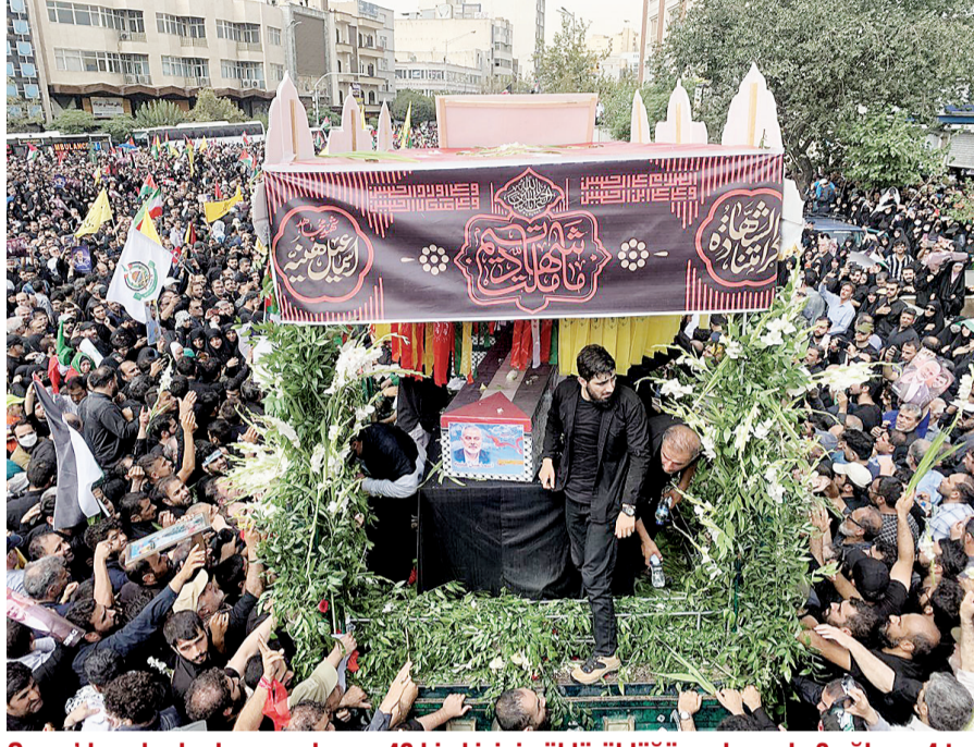
Gazze'de aylardır devam eden ve 40 bin kişinin öldürüldüğü soykırımda 3 oğlu ve 4 torununu kaybeden Hamas lideri İsmail Haniye'nin İran'da uğradığı suikast sonucu öldürülmesinin ardından Tahran'da cenaze töreni düzenlendi. Törene on binlerce kişi katıldı.