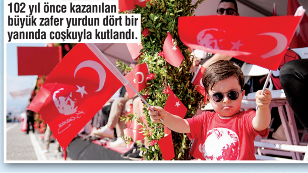
102 yıl önce kazanılan büyük zafer yurdun dört bir yanında coşkuyla kutlandı.

■ HAVA Kuvvetleri Komutanlığı'nın gururu Türk Yıldızları, 30 Ağustos Zafer Bayramı ve Türk Silahlı Kuvvetleri Günü nedeniyle Anıtkabir'de düzenlenen tören sonrası gökyüzünde muhteşem bir şölen sundu. Anıtkabir semalarında Türk bayrağını dalgalandıran Türk Yıldızları, gerçekleştirdiği gösteriyle tüm Türkiye'yi coşkuyla bir araya getirdi. Pilotların kusursuz uyumu ve jet uçaklarının gökyüzünde sergilediği akrobatik manevralar, izleyenlere unutulmaz anlar yaşattı. Türk Yıldızları, saat 18.00'de Mogan Gölü üzerindeki gösteri uçuşuyla Zafer Bayramı çerçevesindeki uçuş faaliyetlerini tamamladı.