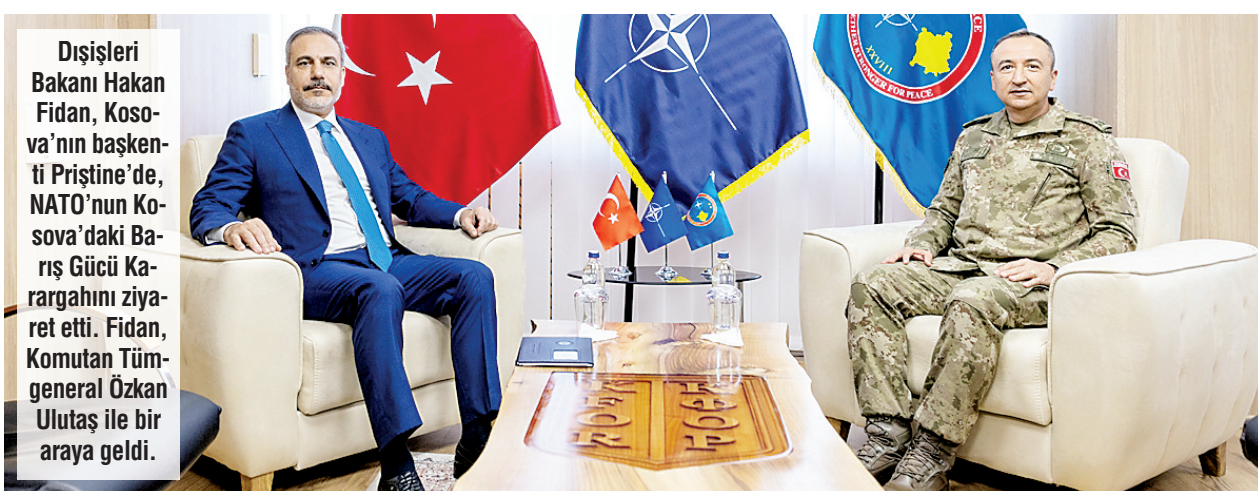
Dişişleri Bakanı Hakan Fidan, Kosova'nın başkanı Pristine'de, NATO'nun Kosova'daki Barış Gücü Karargahını ziyaret etti. Fidan, Komutan Tümgeneral Özkan Ulutaş ile bir araya geldi.

cileri kayıplara karıştı. Şirketin kapanışıyla birlikte 3 milyon kişinin mağdur olduğu belirtiliyor. Şirketin faaliyetleri, kullanıcıların yüksek kar vaatleriyle çekildiği ve sonrasında dolandırıldığı bir sistemin örneğini oluşturuyor.