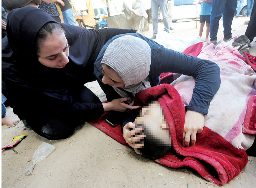
İsrail ordusunun Gazze'nin orta kesiminde yer alan Nuseyrat Mülteci Kampı'na düzenlediği saldırıda birçok kişi yaşamını yitirdi ve yaralandı. Saldırıda hayatını kaybedenlerin naaşları, El-Avde Hastanesi'ne getirildi.

■ WASHINGTON Post'un haberinde, Gazze'de ateşkes müzakerelerine ilişkin ABD'li yetkililerin iddialarına yer verildi. Yetkililer, ABD Başkanı Joe Biden yönetiminin devam eden müzakerelerde 'kabul et ya da reddet biçiminde' son bir ateşkes teklifi sunmaya hazırladığını öne sürdü. Söz konusu teklifi iki tarafın da reddetmesi halinde ABD öncülüğündeki müzakerelerin sona erebileceğine işaret eden yetkililerden biri, "Bunu müzakere etmeye devam edemezsiniz. Bu sürecin bir noktada sonlandırılması gerekiyor" ifadelerini kullandı.