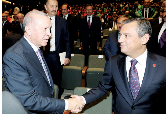
Yargıtay Başkanlığında 2024-2025 Adli Yıl Açılış Töreni'ne katılan Cumhurbaşkanı Erdoğan, CHP lideri Özgür Özel ile selamlaştı.

■ CUMHURBAŞKANI Recep Tayyip Erdoğan, törende yaptığı konuşmada şunları kaydetti: "Toplumun iç barışı için adalet vazgeçilmezdir. Toplumun huzuru, iç barışı, refahı ve güvenliği için vazgeçilmez kavramlar vardır. Bunların en başında adalet yer alır. Adalet mülkün temelidir" ifadesi, devletin adalet üzere ayakta durduğunun sembolüdür. Devletin temel direği, varlık sebebi, meşruiyet kaynağı adalettir." ■ 2024-2028 yıllarını kapsayan Türkiye Yüzyılı yargı reformu belgemizi önümüzdeki süreçte milletimizle paylaşacağız. Yeni anayasa konusunda kemikleşmiş ön kabullerden kaynaklı bir kakafoni yürüyor. Yeni anayasada önümüzdeki en büyük engel önyargılar. Darbe anayasasından kurtulmalıyız. Biz samimi ve kararlıyız. Türkiye yeni anayasaya hazırdır. Mahkeme kararları herkes için bağlayıcı, hukuk devleti olmak bunu gerektirir ama kararlar eleştirilebilir.