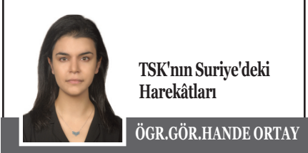
TSK'nın Suriye'deki Harekâtları