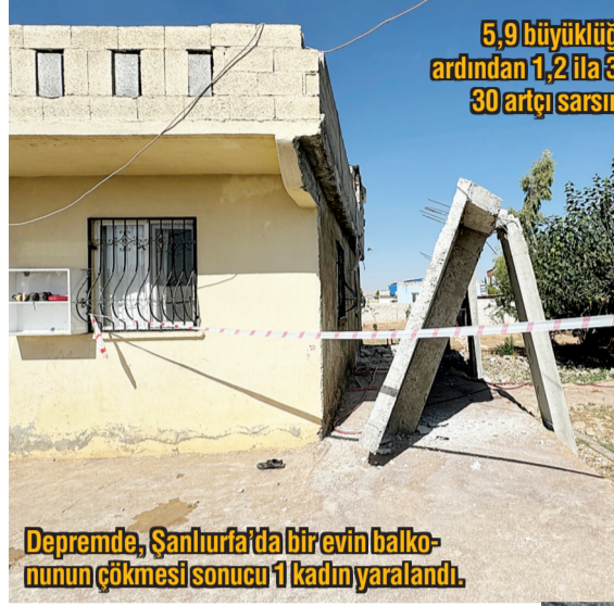
Depremde, Şanlıurfa'da bir evin balkonunun çökmesi sonucu 1 kadın yaralandı.