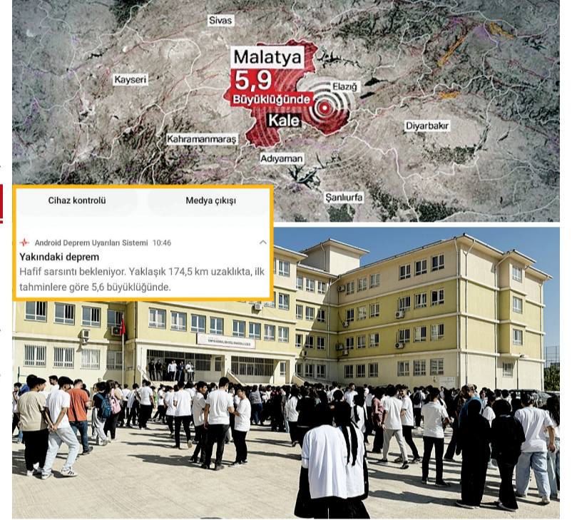
Valilikler tarafından yapılan açıklama sonrasında Elazığ, Batman, Adıyaman, Malatya ve Şanlıurfa'da deprem sonrasında okullar bir günlüğüne tatil edildi.