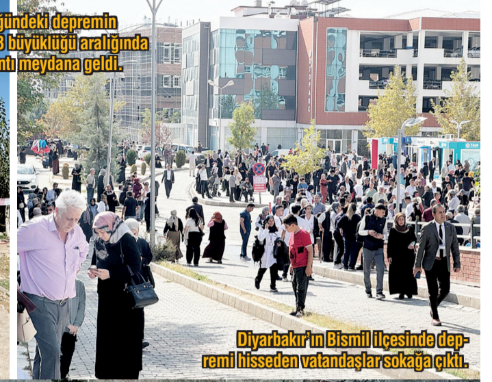
Diyarbakır'ın Bismil ilçesinde deprem hissedilen vatandaşlar sokağa çıktı.

Malatya'da merkez üssü Kale ilçesi olan 5,9 büyüklüğünde deprem yaşandı. Birçok ilde hissedilen deprem sonucu 3 binada kısmi çökme meydana geldi.