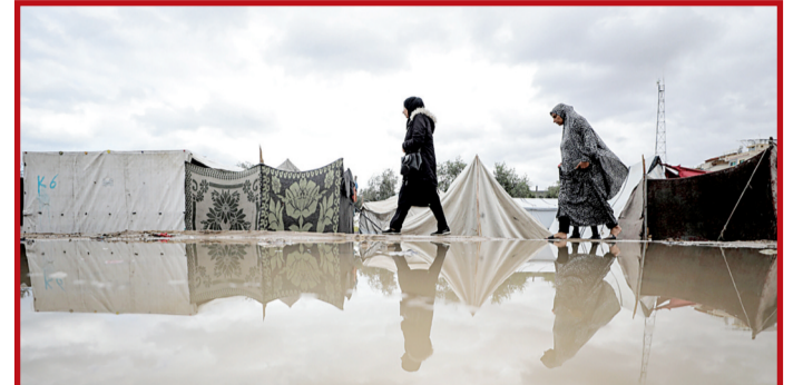
Terörist İsrail'in saldırılarının başlamasından bu yana 2,3 milyon nüfuslu Gazze'de 2 milyon kişi zorla yerinden edildi.

■ İSRAİLİN Gazze'de sürdürdüğü soykırımda ailelere dönük "7 bin 160 katliam" işlediği aktarıldı. Bir yıldır devam eden soykırım sırasında 1410 ailenin tamamının, 5 bin 444 ferдинin öldüğü ve bu ailelerin nüfustan silindiği ifade edilen açıklamada, 3 bin 463 ailenin sadece bir ferдинin, 2 bin 287 ailenin ise birden fazla ferдинin hayatta kaldığı aktarıldı.