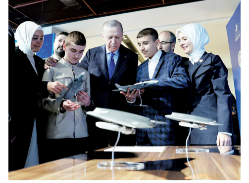
Cumhurbaşkanı Erdoğan, AK Parti Kongre Merkezi'ndeki Engelsiz Türkiye Programı'na katıldı.

Kahramanmaraş merkezli depremler 11 ilde büyük yıkıma neden oldu. Depremler sonrasında bölge esnafına vergi kolaylığı sağlayan mücbir sebep hali sona erdi. Bölge halkı 2011'deki Van depremi örneğini vererek, yaraların sarılması ve ekonominin canlanması için sürenin uzatılmasını bekliyor