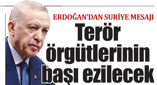
ERDOĞAN'DAN SURİYE MESAJI

■ SURİYELİ güvenlik kaynağı, İsrail birliklerinin İsrail işgali altındaki Golan Tepeleri'ni Suriye'den ayıran, askerden arındırılmış bölgenin doğusunda Suriye topraklarının 10 km içerisindeki Katan'a'ya ulaştığını söyledi. Öte yandan İsrail, El-Beyda ve Lazkiye limanlarında Suriye donanmasına ait gemi filosunu imha etti. İsrail'in düzenlediği hava saldırılarında, Suriye'nin kuzeydoğusunda yer alan Kamışlı Askeri Havalimanı da vuruldu. / 7'DE