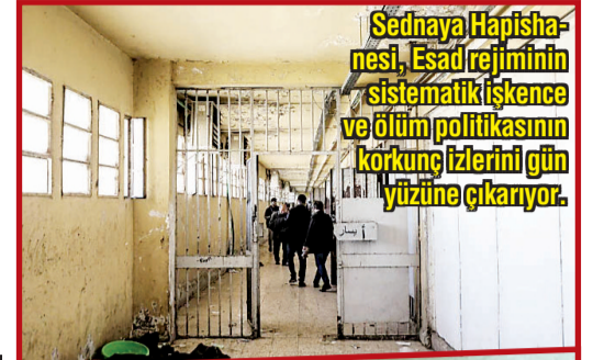
Sednaya Hapishanesi, Esad rejiminin sistematik işkence ve ölüm politikasının korkunç izlerini gün yüzüne çıkarıyor.

■ BAŞKENT Şam'ın dışında bulunan bu yer, bir tepede yer alıyor ve 1,4 kilometrekarelik bir alanı kaplıyor. 2017 tarihli bir Uluslararası Af Örgütü raporu, Sednaya Hapishanesinde binlerce kişinin toplu olarak asıldığını tespit etti. Hapishane bu olayın ardından, "İnsan Mezbahası" olarak nitelendirildi. Her hafta 20 ila 50 kişi, genellikle pazartesi ve çarşamba geceleri öldürülüyordu. Uluslararası Af Örgütü, Eylül 2011 ile Aralık 2015 arasında 5 bin ila 13 bin kişinin idam edildiğini tahmin ediyor. Hayatta kalanlar ise yoğun acılara katıldılar. Gözleri sürekliliğe bağlı, havalandırma deliklerinden ve borulardan gelen dayak ve çığlık seslerini duyabiliyorlardı. / 7'DE