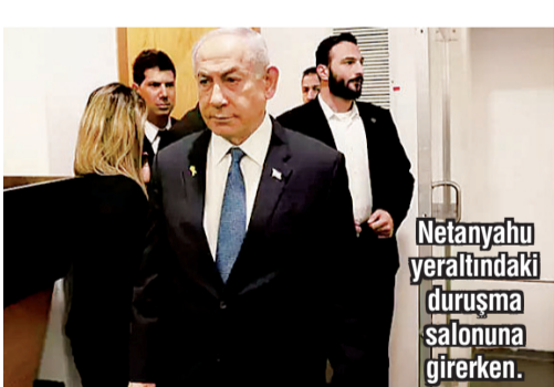
Netanyahu yeraltındaki duruşma salonuna girerken.

■ BAZI mahkumlar, 2,5 metreye 1,5 metre boyutlarında, tek kişilik olarak tasarlanmış dondurucu hücrelerde yer altında tutulduklar, ancak aynı anda 15 kişiye kadar yer sağlanıyordu. Hapishaneler boşaldıkça, her yerdeki Suriyeliler sevindiklerinden, birçoğu yıllardır kayıp olanlardan haber almak için çaresizce çırpınıyor. Muhalif yetkililer, sosyal medyadan, Esad rejimindeki eski askerlere ve cezaevi çalışanlarına, elektronik yeraltı kapılarının kodlarını vermeleri çağrısında bulundu.