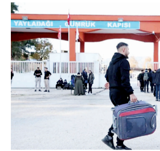
Suriyelilerin dönüş yoğunluğunu azaltmak için 11 yıldır kapalı olan Yayladağı Hüdud Kapısı yeniden açıldı. Suriyeliler, bu sınır kapısını da kullanıyor.

■ İÇİŞLERİ Bakanı Ali Yerlikaya, Suriyelilerin ülkelerine dönme konusunda istekli olduklarını söyledi. Sınır kapılarında yaşanabilecek olası yığılmalara karşı yeni önlemlerin alındığını belirten Yerlikaya, "Sınır kapılarında günlük 3 bin kapasitemiz varken bunu 15-20 bine kadar artırdık" bilgisini paylaştı. / 6'DA