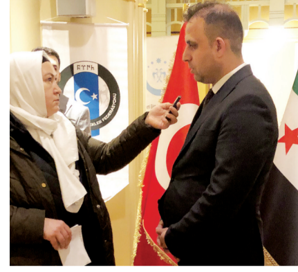
Cevzici haklı bir soru soruyor.

ikinci İsrail kurulması. İsrail PKK'ya bunun için açıktan destek veriyor. Amerika'da himayesini üstlenmiş bir vaziyette. Amerika siyasi desteğin ötesinde askeri ve istihbarat desteği de sağlıyor. Bu da Suriye'nin yeniden üniter yapısına kavuşmasında büyük bir engel aslında. Amerika ve İsrail şu an Suriye'de birtakım bozucu rol üstlenmiş halde.