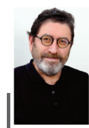
Bir Füsün Oldu Bana

Deprem, heyelan, sel afetlerine veya terör olaylarına maruz kalmaları nedeniyle "KOSGEB Acil Destek Kredisi Programı"ndan yararlanılanlar, KOSGEB ile Dünya Bankası arasında 1 Ağustos 2023'te imzalanan kredi anlaşması kapsamında Deprem Sonrası Mikro, Küçük ve Orta Ölçekli İşletmelerin Canlanması Destek Programı'ndan faydalanan esnaf ve sanatkarlar bu fıkra hükmünden istisna tutuldu.(AA)