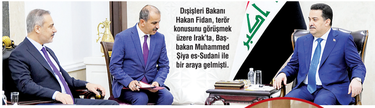
Dışişleri Bakanı Hakan Fidan, terör konusunu görüşmek üzere Irak'ta, Başbakan Muhammed Şiye es-Sudani ile bir araya gelmişti.

Türkiye'nin Irak ile son dönemde geliştirdiği ilişkiler ve Suriye'de ortaya çıkan yeni siyasi durum, terör örgütü PKK'nın yaklaşık 35 yıldır beslendiği "siyasi bataklık zemininin kurutulması" konusunda umutları artırdı