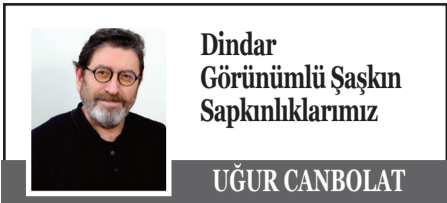
Dindar Görünümlü Şaşkın Sapkınlıklarımız