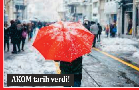
AKOM tarih verdi!

İSTANBUL'A KAR VE SİBİRYA SOĞUKLARI GELİYOR