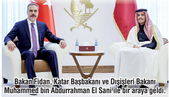
Bakan Fidan, Katar Başbakanı ve Dışişleri Bakanı Muhammed bin Abdurrahman El Sani ile bir araya geldi.

■ "TÜRKİYE üzerine düşeni yapacak. Yeter ki ateşkes anlaşması devam etsin" diyen Fidan, "Sayın Cumhurbaşkanımız, anlaşmaya destek vermek için diğer ülkelerle beraber bazı Filistinliler ev sahipli yapma konusunda hazır olduğumuzu ifade etti" diye konuştu. Fidan, Suriye'deki terör sorunu için ise şunları söyledi: "Şam'ın YPG'ye yönelik çözüm gayretleri zürüyor. Bu meselenin kan dökülmeden çözülmesi umudumuz. Çok yakından takip ediyoruz. Suriye'de terörün yer bulmasına müsamaha gösterme şansımız yok." / 6'DA