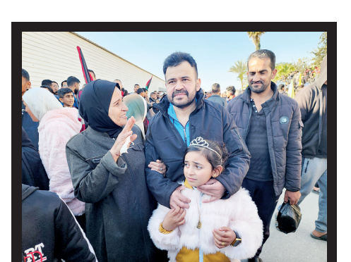
Hamas ile İsrail arasındaki dördüncü tur esir takasında 183 Filistinli esir serbest kaldı. Yıllardır İsrail hapisanelerinde tutulan ve takas kapsamında serbest kalan Gazze'de esirler Han Yunus kentine ulaştı.