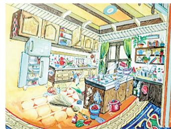
Bir kadının hayatına eleştirel bir bakış