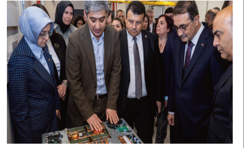
TBMM Yapay Zeka Araştırma Komisyonu üyeleri süper bilgisayar "ARF ACC" hakkında bilgi aldı

Okur, bunu da laboratuvar ortamında minare modelinde denediklerini, bunun Türkiye'de aktif halde kullanılmasını sağlamak için çalışmalarını kaydetti.(AA)