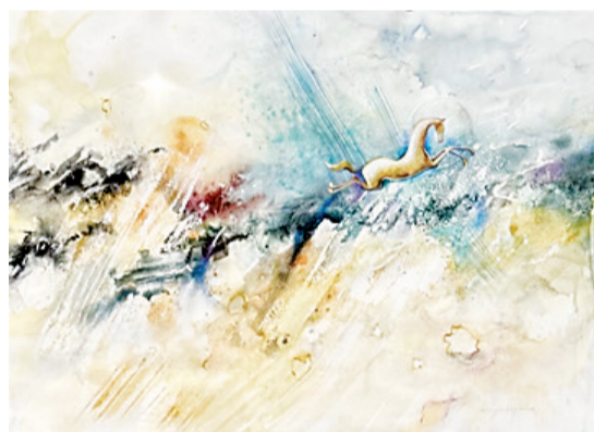
"Ben Rabbime gidiyorum. O, bana doğru yolu gösterecektir." Saffat Suresi