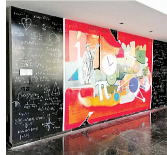
Eyüpsultan - Matematik evi

-Bu, duruma göre değişir. Bazen kitapların film uyarlamalarını izlediğimizde, "Keşke izlemeseydim, hayalimde daha güzeldi." deriz. Bazen de resim o kadar iyi anlatır ki söze gerek kalmaz.